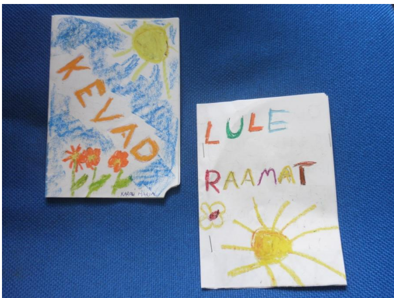
Kaks kevadist luulekogu (mitte veel päris valmis)

Luuleraamatu kujundab laps selliseks, nagu ise soovib ja luuletusi võib sinna alati juurde lisada. Grupitööna teevad lapsed ühisluletuse ja kõik aitavad kujundada. Õpetaja võib aeg-ajalt teemasid pakkuda vastavalt õppetegevuste teemadele. Parimaid luuletusi õpitakse pähe ja kantakse erinevatel üritustel ja pidudel ette. Omaloomingulisel luuletusel on väga suur väärtus.