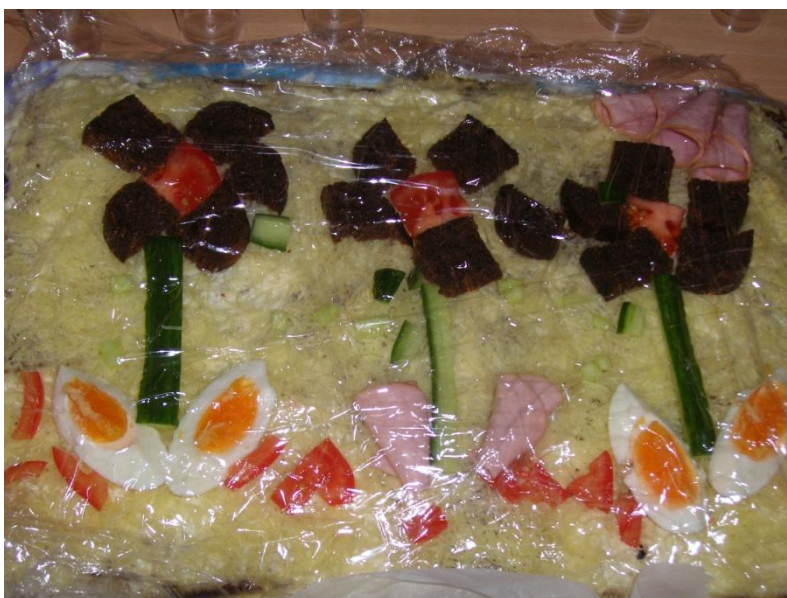
Kaunis ja tervislik tort