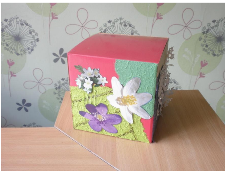
Aastaringne vanasõnade kastike, meisterdanud K. Treulich-Trubetski