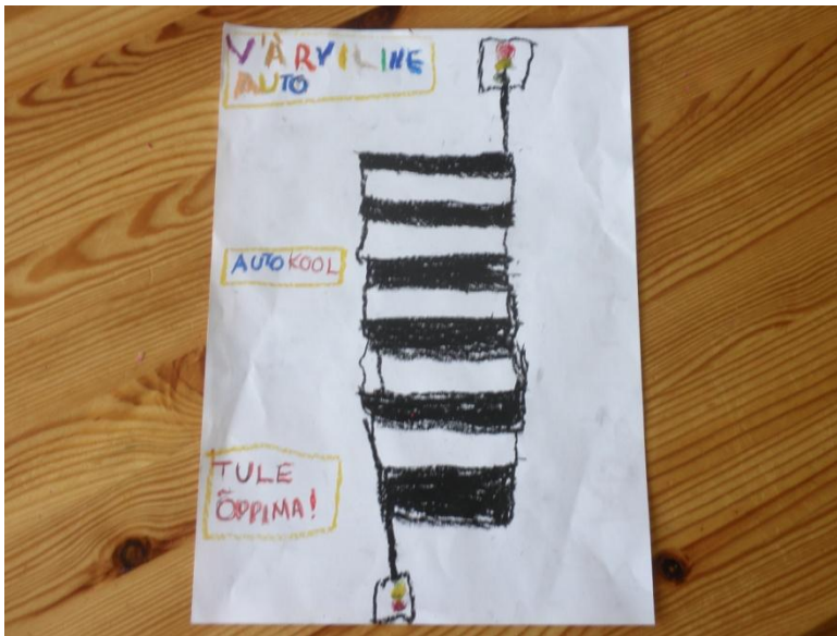
Autokool VÄRVILINE AUTO

Lapsed on jaotatud gruppidesse. Iga laps tõmbab pimesi endale kaardi liiklusmärgiga. Seejärel selgitavad grupid kordamööda enda käes oleva märgi tähendust, siis grupp saab otsustada, millist liiklusteemalist situatsiooni hakatakse teistele ette mängima.