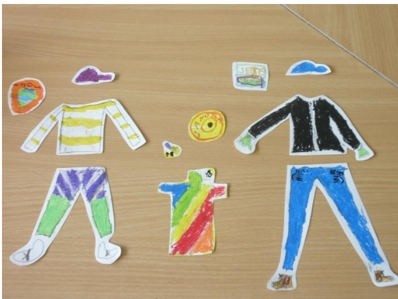
Spordiriided Eesti sportlastele

Oluline on see, et firma iga töötaja saaks esitlusel sõna võtta. Kõik ülejäänud kuulavad ja jälgivad esitlust. Kui mõni laps jääb oma osaga esitlusel hätta, siis tulevad talle appi tema töökaaslased samast grupist.