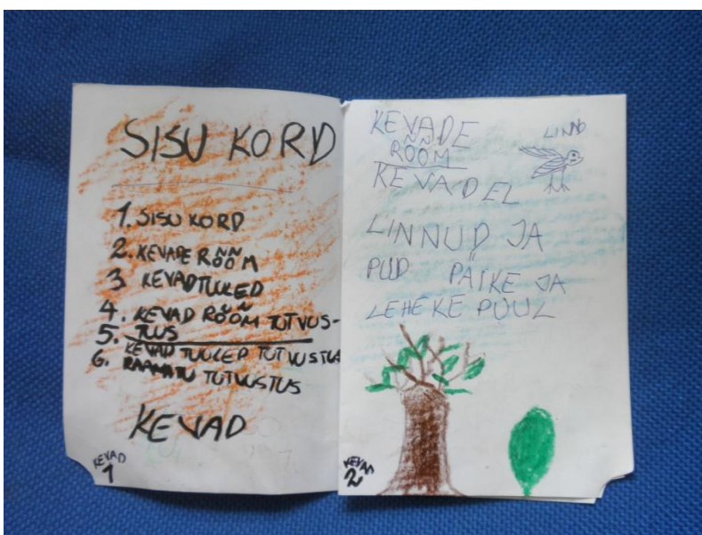
Noore luuletaja luulekogu