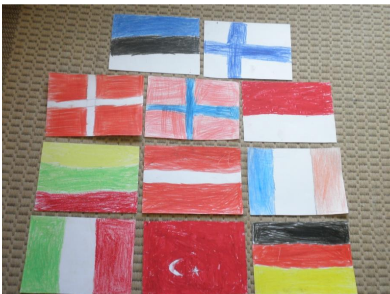
Euroopa riikide lipud

Tervisliku eluviisi propageerimine on tänapäeval väga aktuaalne. Anname ka lastele võimaluse välja pakkuda oma nägemust sellel teemal.